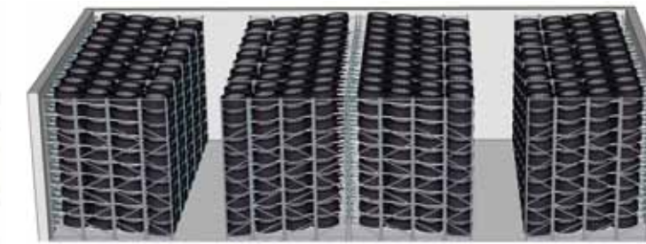
ergowheel® – bis zu 30% mehr Lagerkapazität